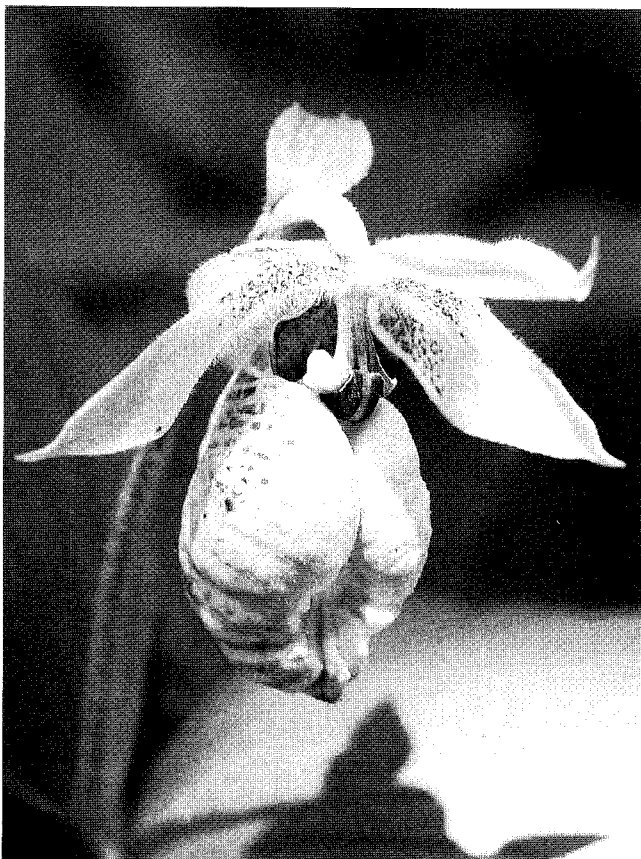
クマガイソウ(熊谷草) 都立殿ヶ谷戸庭園(JR 国分寺駅下車徒歩2分) 平成 21 年撮影

株式会社 三ツ和 小諸そば事業部 本社 〒104 東京都中央区新川2丁目13番8号 ☎03(3555)0092